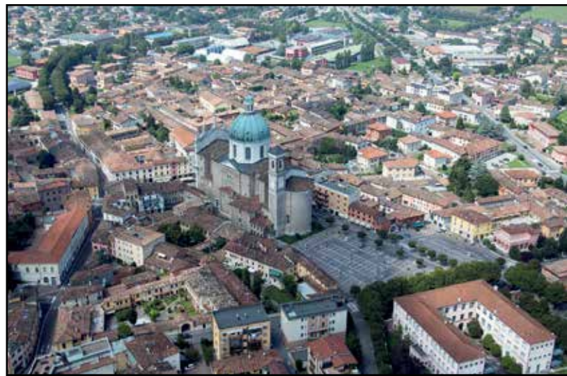
Il centro storico di Montichiari.

Oltre 630 mila euro verranno utilizzati per proseguire l'opera di manutenzione delle strade e si avvieranno le opere di conservazione del perimetro murario del Castello Bonoris, opera ormai divenuta urgente e improrogabile. Entro l'estate, inoltre, sarà sotto i ferri Piazza Treccani con un intervento che le ridarà un volto più presentabile e soprattutto sicuro per pedoni e automobilisti. Nel