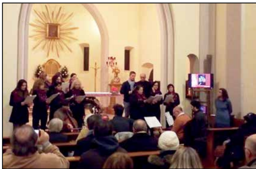
Un momento della manifestazione.