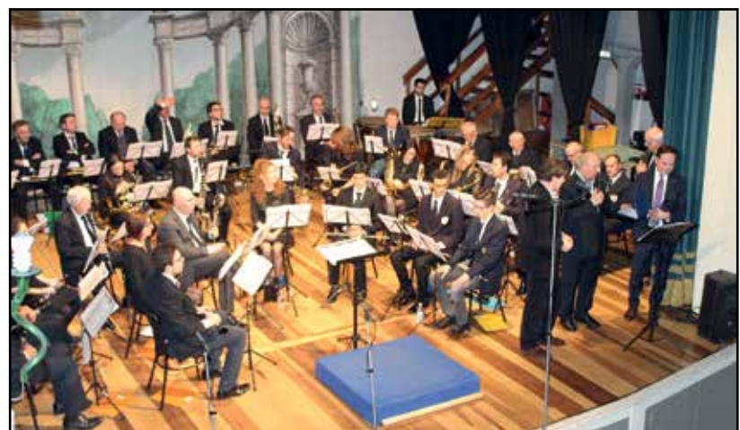
La consegna della targa da parte del Sindaco e del Presidente al rappresentante dei palchettisti.

Ancora una volta dunque è stato ampiamente confermato l'altissimo livello raggiunto