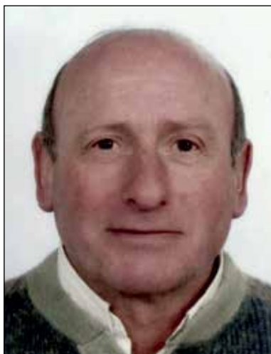
Guglielmo Balestrini 1° anniversario